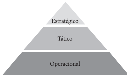
Figura 1 – Níveis administrativos

Fonte: Adaptado de Ansoff, McDonnell, 1993, p. 95.